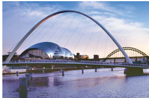
Eyre, Gateshead Millennium Bridge Forster, The Sage Gateshead