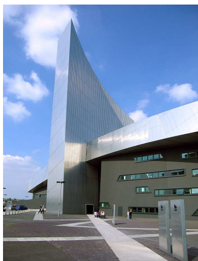
Libeskind, Imperial War Museum

Dies ist ein Reiseangebot für Freundinnen und Freunde der Insel, dem Mutterland – nachdem wir 2009 in den Neuengland-Staaten waren. Abseits der Metropole London interessieren die alten Industriestädte Manchester, Liverpool und Newcastle und deren Umbau in Zentren für Wissenschaft, New Media und Kunst. Daneben gibt es aber auch eine Stadt wie Edinburgh zu entdecken (oder wiederzuentdecken), unzerstört mit langer Geschichte und dann die unvergleichliche Landschaft mit ihren idyllischen Dörfern, den Parks und ruhigen Unterkünften.