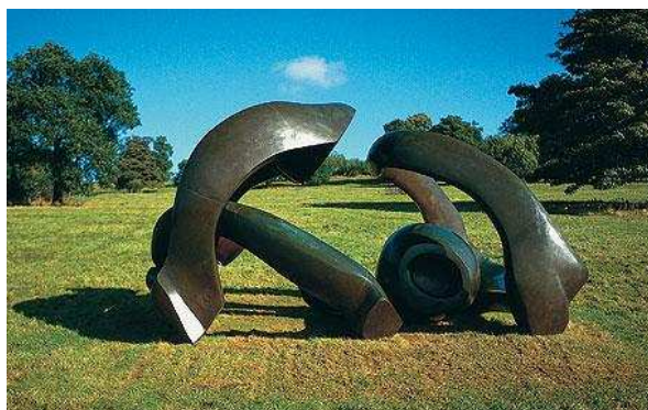
Moore, Yorkshire Sculpture Garden